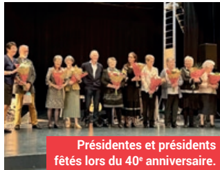
Présidentes et présidents fêtés lors du 40 e anniversaire.

Les portes ouvertes auront lieu le samedi 6 avril de 10h à 17h, dans la salle culturelle de la Cressonnière.